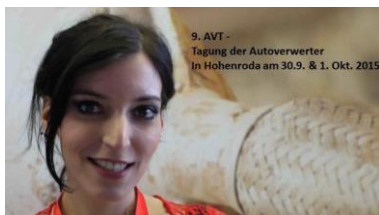
9. AVT - Tagung der Autoverwerter in Hohenroda am 30.9. & 1. Okt. 2015